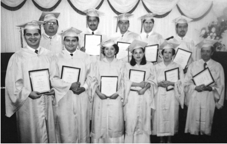
Clase del 2002