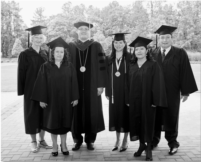
Clase del 2013