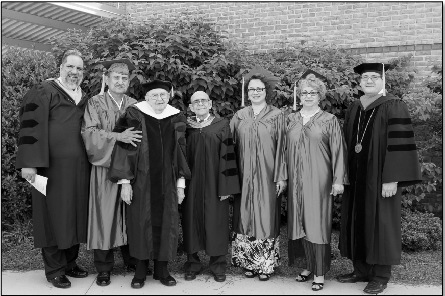
Clase del 2015