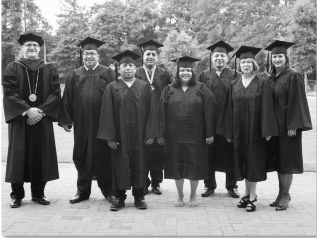
Clase del 2014