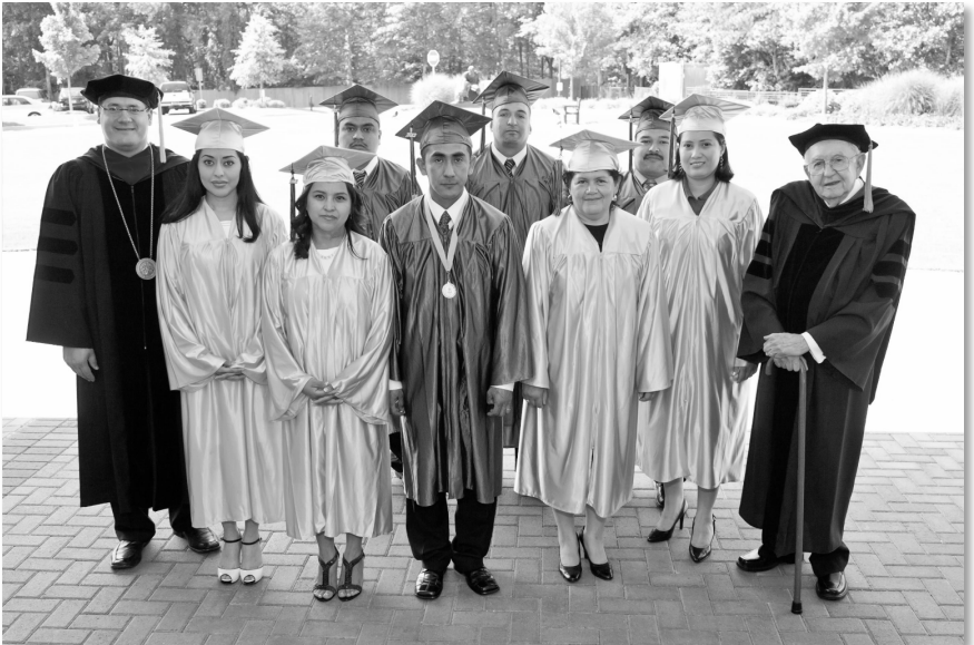
Clase del 2012