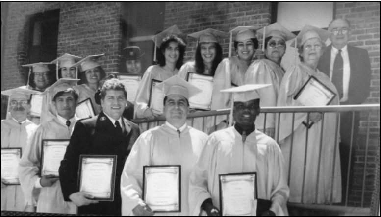
Clase del 1997