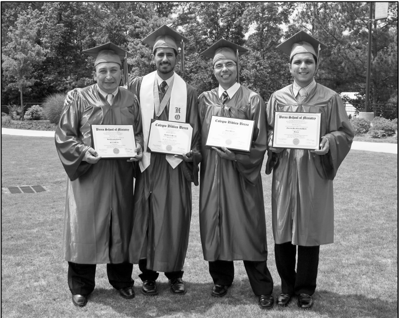
Clase del 2010